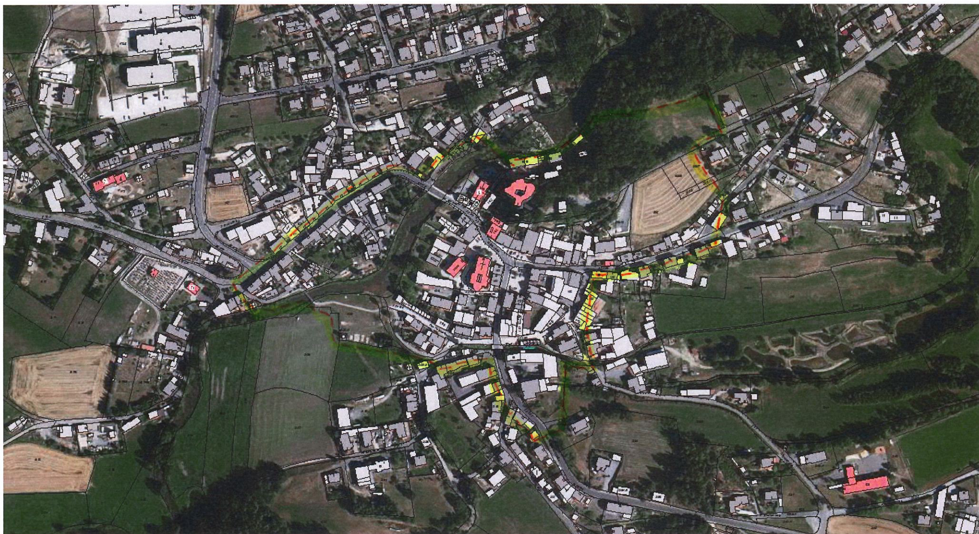
Geltungsbereich für die Einzelfallanordnung vom 19.07.2024 anlässlich des Bürgerfests 2024 in Falkenberg